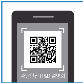
QR코드를 카메라 촬영